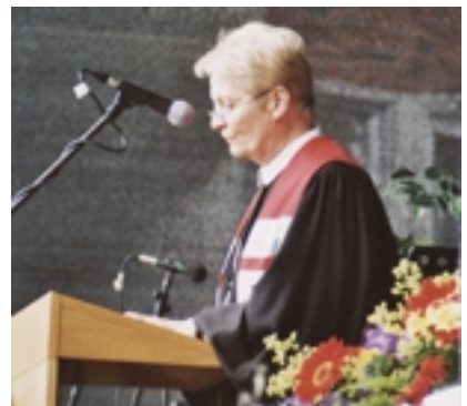
Landessuperintendentin Oda-Gebbine Holze-Stäblein beim Abschlussgottesdienst vor 2500 Gästen.