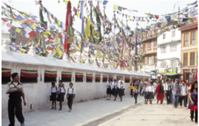
Keine Frage: Kathmandu ist eine faszinierende Stadt, die das Ehepaar mit Begeisterung erkundet hat. Unser Foto zeigt eine Szene vor der buddhistischen Stupa in Bodnath.