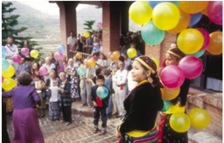
Ein bewegender Augenblick zu Beginn der Feierlichkeiten in Godavari: Zwei Mädchen in nepalischer Tracht verteilen Luftballons, die UMN-Freunde und Mitarbeiter dann gen Himmel steigen lassen.

Und natürlich wurde immer wieder die Entstehungsgeschichte erzählt: Eine Geschichte aus den frühen 50er Jahren, als das Land völlig isoliert und von der Außenwelt abgeschnit-