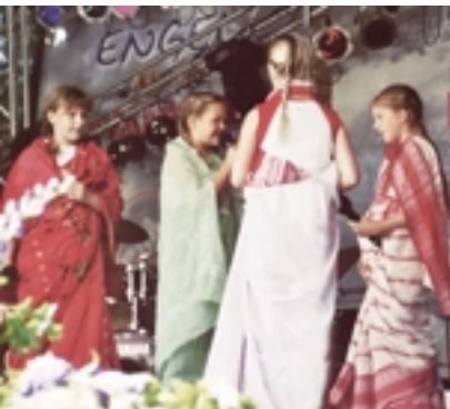
Die Schülerinnen der Dollartschule brillieren mit ihrem Theaterspiel auf der Hauptbühne.