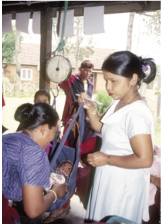
Am Gesundheitsposten Chapagaon wird ein Baby gewogen. Im Hintergrund warten andere Mütter auf die Untersuchung. In Chapagaon, von der UMN 1954 gegründet, werden Eltern aufgeklärt über die richtige Ernährung, über notwendige Impfungen und über die Bedeutung von Familienplanung.

Neue Organisationsformen wurden ausprobiert, die Zusammenarbeit mit lokalen Trägern und Einrichtungen begonnen. »Private limited companies« wurden für die von der UMN initiierten Wasserkraftwerke und einige expandierende Industriebetriebe in Butwal gegründet. In diese Zeit fielen erste Überlegungen darüber, wie die von der UMN verwalteten Krankenhäuser und Schulen zukünftig in nepalisches Management und Verantwortung übergeben werden könnten. Als Beispiel für eine gelungene Übergabe aus dieser Zeit lässt sich die »King Mahendra Highschool für Mädchen« in Kathmandu anführen, die aus UMN-Hand in staatliche Regie überführt wurde. Bei anderen Projekten, z.B. den UMN-Krankenhäusern, erwies sich eine Übergabe als schwieriger.