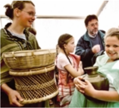
Ender Bilderbogen: Die Mädchen der Dollartschule bereiten sich auf ihr Anspiel vor.