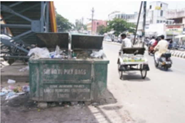
Eine Straßenszene in Ranchi: Die Mülltonnen quellen über. Immerhin gibt es neuerdings auch Container für Plastikabfall.

Ranchi hat sich in den letzten vier Monaten während unseres Deutschland-Aufenthaltes verändert. Wir konnten es kaum glauben, dass in den Straßen plötzlich große Müllcontainer für Plastikabfall stehen. Endlich wurde die Plastikflut auch hier erkannt, und man hat etwas dagegen getan. Die Container sind allerdings nach ihrer Leerung plötzlich wieder ver-