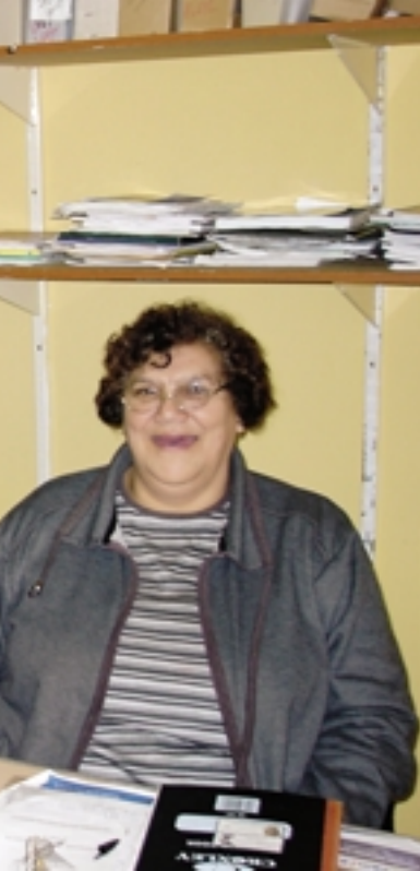
viertel in Kapstadt. Mit ihrer Gewerk-

verteidigt werden, indem die aktive Teilnahme und Selbstorganisation der Menschen in den Townships und Gemeinden gefördert und organisiert wird.