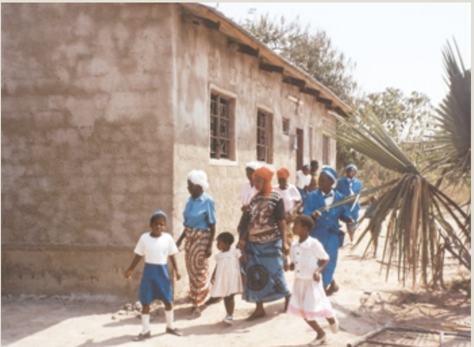
Bild rechts: Das Foto vom Sommer 2003 zeigt die Rückseite des neu erbauten (damals noch nicht ganz fertiggestellten) Pfarrhauses in Itezhi-Tezhi. Die Gemeinde freut sich über den neuen Mittelpunkt.

Ulrich Schlottmann, ehemaliger Mitarbeiter der Gossner Mission in Sambia