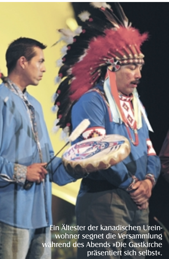
Ein Ältester der kanadischen Ureinwohner segnet die Versammlung während des Abends »Die Gastkirche präsentiert sich selbst«.

meinem »Dorf« ging es um die »Mission der Kirche in multi-religiösen Kontexten«. Wir begannen die Gesprächsrunden, die innerhalb der Dörfer in Kleingruppen von etwa zehn Personen geführt wurden, mit der Betrachtung eines bibli-