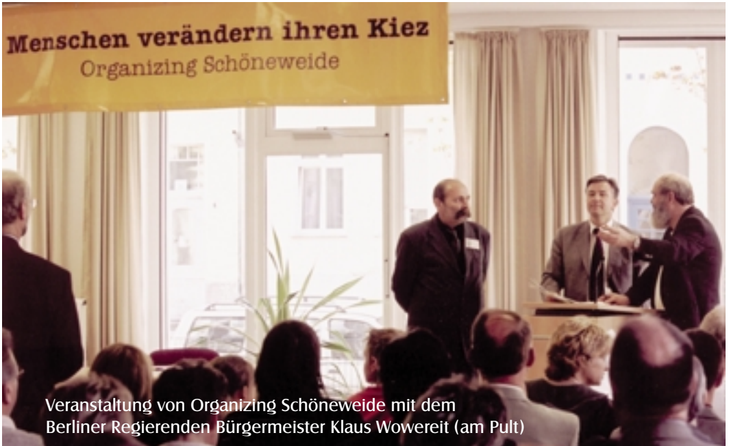
Veranstaltung von Organizing Schöneweide mit dem Berliner Regierenden Bürgermeister Klaus Wowereit (am Pult)

Bürgerinnen und Bürgern war anzumerken, dass sie jetzt etwas von dem Ruck verspürten, den ein ehemaliger Bundespräsident schon vor Jahren eingefordert hatte: es würde voran gehen im Stadtteil. 2000 Studentinnen und Studenten würden Leben zurückbringen in eine Region, in der vor der Wende noch 40.000 Menschen in der Industrie gearbeitet hatten, während 10 Jahre später von ihnen knapp 1.500 übrig geblieben sind.