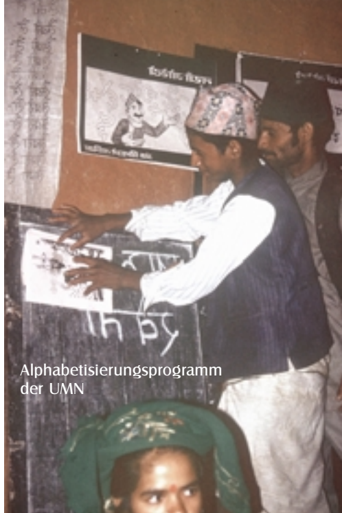
Alphabetisierungsprogramm der UMN

Was macht die Verantwortlichen von UMN so mutig, nach 50 Jahren Nepalerfahrung solch einschneidende Veränderungen und Umwandlungen einzuleiten? Zum einen die Gesetzeslage: UMN wird sich als Internationale NRO in Nepal anerkennen lassen, um ihre Arbeit in Nepal weiterführen zu können. Die langjährigen Erfahrungen sollen genutzt und fortgeführt werden. Dafür hat sich die Versammlung der Mitglieder entschieden. Da vom Gesetz für die unmittelbare Arbeit einheimische Institutionen und Organisationen gefordert