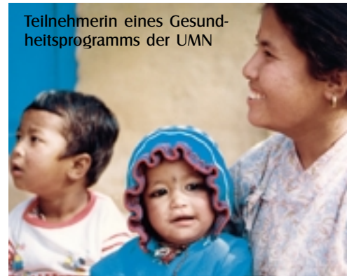
Teilnehmerin eines Gesundheitsprogramms der UMN

nach den Bedürfnissen zentral entwickelt und bieten z.T. wesentliche Erleichterungen und auch Vergünstigungen. Die fortgeschrittene technische Ausstattung (Computer, EDV, Intranet u.a.) macht die Mitarbeit einiger Fachleute geradezu zwingend. Freilich machen sie nur Sinn bei ausreichendem Bedarf einer Zentrale. Wie das in den kleineren Zentren gehen wird, muss sich zeigen. Vielleicht wird man ganz neue Lösungen suchen müssen, um den Bedarf zu befriedigen.