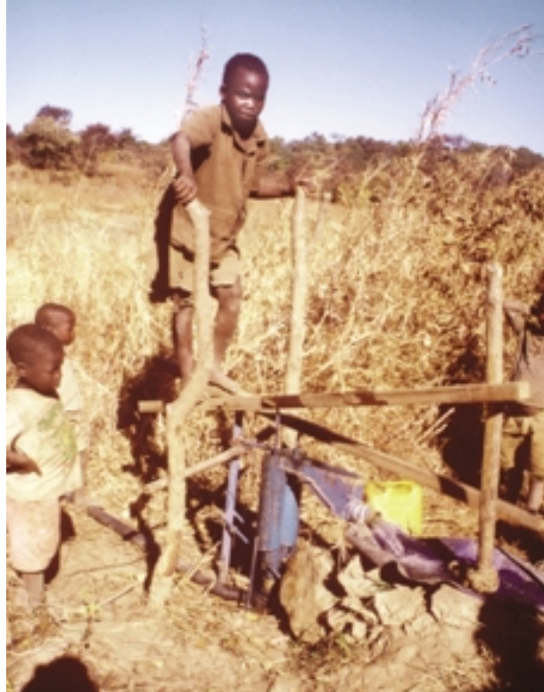
Nachhaltige Landwirtschaft – auf dem Bild eine einfache Bewässerungsmethode – gehört zu den erfolgreichen Projekten der Kaluli Development Foundation im Gwembetal.

Kuratorium der Gossner Mission haben sich deshalb dafür ausgesprochen, Ibex Hill zu einem ökumenischen Zentrum ausbauen und mit diesem Zentrum ein spezifisches inhaltliches Angebot zu verbinden. Man denkt hier vor allem an eine engere Zusammenarbeit mit der United Church of Sambia. Diese Kirche hat bereits damit begonnen, kleinere »Workshops« und Seminare in Ibex Hill durchzuführen und sie hat offiziell angefragt, ob die Gossner Mission sie bei der Ausbildung ihrer Pfarrer, Diakone und ehrenamtlichen Mitarbeiter unterstützen könnte, insbesondere auf dem Gebiet der gesellschaftsbezogenen Dienste. Nach unserer Wahrnehmung sind die Kirchen in Sambia zunehmend daran interessiert, wirtschaftlich unabhängig zu werden und eigene nachhaltige Entwicklungsprogramme ins Leben zu rufen. Sie benötigen dafür Beratung bei der Planung solcher Vorhaben. Und sie benötigen geeignete Ansprechpartner. Auch hier könnte Ibex Hill bei entsprechender personeller Ausstattung hilfreich sein. Anlässlich der Sambiareise des Direktors und des Sambiareferenten im Mai dieses Jahres sollen diese Ansätze in Gesprächen mit unseren Partnern weiter verfolgt werden. Zum Schluss eine persönliche Be-