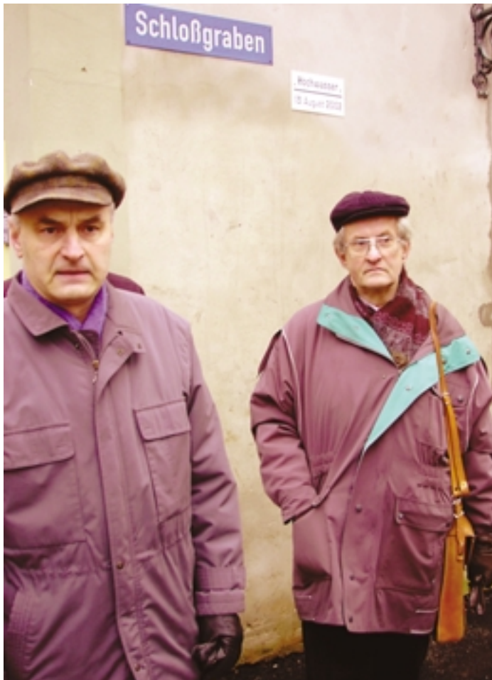
Jahrhundertflut in Grimma: Die Marke neben dem Straßenschild markiert den Wasserstand vom 13. August 2002.

Krise zu bewältigen. Sie wollen, dass alles möglichst schnell wieder so wird, wie es vorher war.« Baehr spricht von Neid, der aufkam, als es um die Verteilung der überreichlich gespendeten Hilfsgüter und -gelder ging. Wer bekommt wie viel? Wessen Laden sieht schöner aus als vorher? Aber er spricht auch von Solidarität, die angesichts der Katastrophe unter Nachbarn entstand. Die Kirchengemeinde wuchs in dieser Zeit über sich