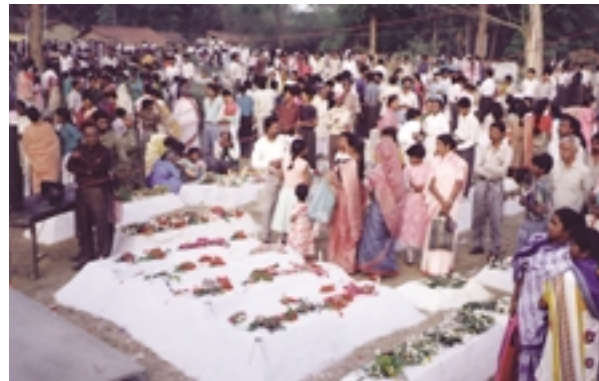
Christen der Gossner Kirche feiern das Osterfest bei den Gräbern der Angehörigen.

Bischof Lakra (lacht überrascht und etwas verlegen): Ihr macht euch schon viele Gedanken und