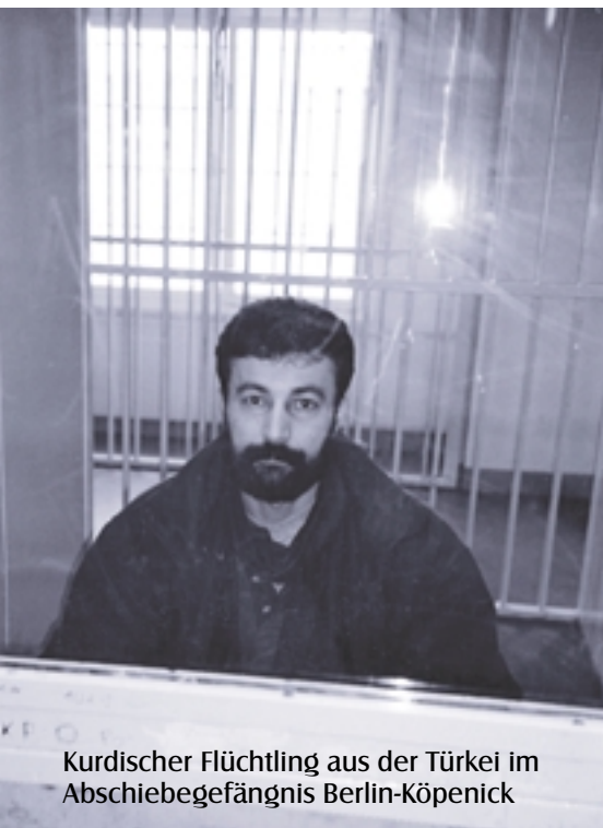
Kurdischer Flüchtling aus der Türkei im Abschiebegefängnis Berlin-Köpenick