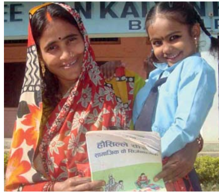
Mutter Sila unterstützt den neuen Kurs der Schule.