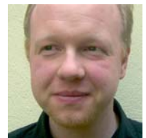
Autor Henrik Weinhold ist Mitarbeiter im Öffentlichkeitsreferat.

Vielleicht hilft eine konsequente Besinnung auf die gemeinsamen Wurzeln den beiden Kirchen bei einer Annäherung. Die Bischöfe Dang und Lakra hatten dazu bei einem Besuch der Berliner Wirkungsstätten des Gründervaters Johannes Evangelista Goßner eine Gelegenheit. Am Grab Goßners kam es dabei zu einem versöhnlichen Händedruck. Ein gewagtes Bild. Es macht Hoffnung, auf dem Weg der Versöhnung voranzugehen. ■