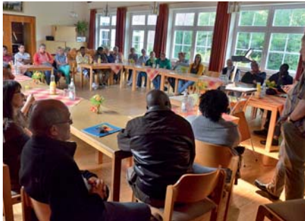
unten: Bewegende Begegnung im Gemeindehaus von Hage (Fotos: Helmut Kirschstein).

Regierung am Ruder“, sagt einer der jungen Flüchtlinge, „da wird sich so schnell nichts ändern.“ Auch die Iraner sehen keine Wende in naher Zukunft. Was schließlich bleibt, ist einerseits ein bedrückendes Gefühl über die Ungerechtigkeit in der Welt – und andererseits die Freude über jeden einzelnen Fall, in dem Hilfe Früchte trägt.