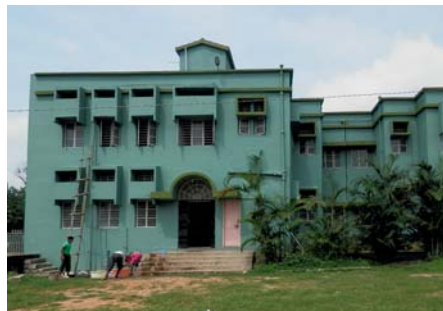
Die Unterkunft der Gossner-Freiwilligen in Ranchi.

? In Deutschland gibt es zurzeit viele Negativschlagzeilen, die Sicherheitslage betreffend. Wie waren Ihre Eindrücke?