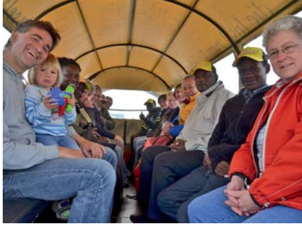
oben: Gäste und Gastgeber unterwegs.

Ob die Flüchtlinge Hoffnung für ihre Länder hätten, fragt er in die Runde. „In Eritrea ist seit 23 Jahren dieselbe