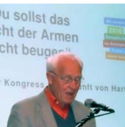
Eindrücke von der Berliner Armutskonferenz.

Pünktlich zum Beginn des Kongresses konnte man in der Tagespresse lesen, dass in Berlin am Vortag die 100.001. Klage beim hiesigen Sozialgericht eingereicht worden war. Der Grund für diese Klageflut: „Unzumutbare Maßnahmen oder verweigerte Leistungen, weil die Ämter versagen und das Hartz-IV-Gesetz schwammig formuliert ist“, wie Michael Kanert, Richter am Berliner Sozialgericht, in einer der Arbeitsgruppen des Kongresses berichtete.