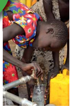
Sauberes Wasser - eines der größten Probleme in den Flüchtlingsiedlungen.