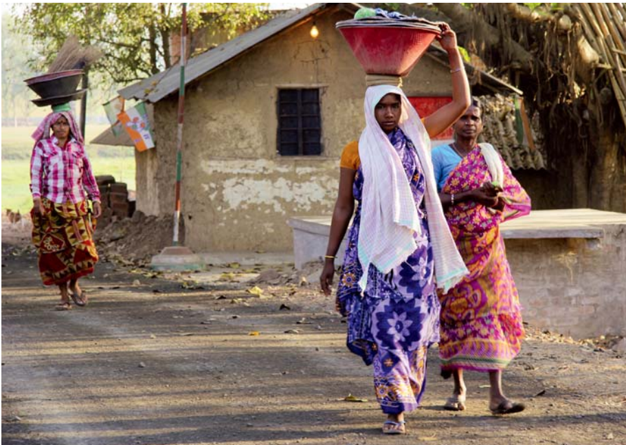
Alltag im ländlichen Indien.