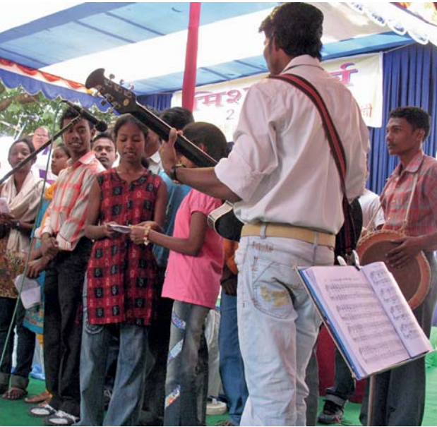
Mit Keyboard und E-Gitarre: christliche Musik heute.