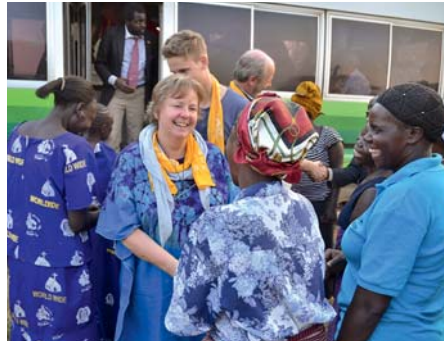
Herzliche Begrüßung, wohin auch immer die Delegation kommt.