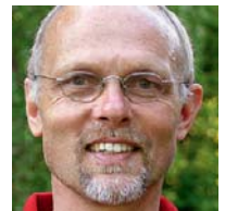
Autor Dr. Volker Waffenschmidt ist Mitarbeiter im Sambia-Referat der Gossner Mission.

Es ist nicht einfach für den mittellosen, meist auch uninformierten Kleinbauern, sein garantiertes, traditionelles Recht gegen diese einflussreichen „Investoren“ durchzusetzen. Die sambische Gesellschaft ist noch immer stark hierarchisch geprägt, obrigkeitshörig. Wer einmal erlebt hat, wie sich erwachsene Menschen vor dem Chief erniedrigen, niederknien, sich ihm kriechend nähern, der ahnt, wie lang der Weg zum aufrechten Gang ist. Und wie notwendig der Aufbau einer starken, selbstbewussten Zivilgesellschaft. ■