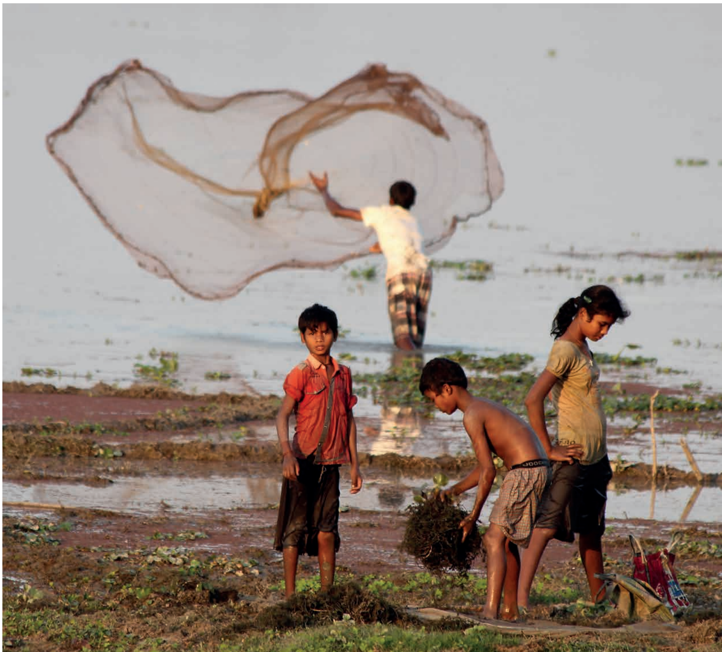
Indien: Kinder in Assam beim Fischfang. | India: Children in Assam fishing. | Inde: Les enfants en Assam dans la pêche.