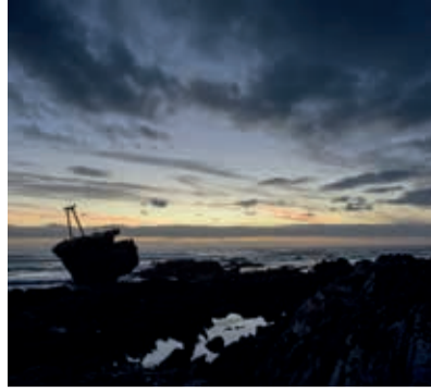
Januar Südafrika January South Africa Janvier Afrique du Sud Thomas Lohnes