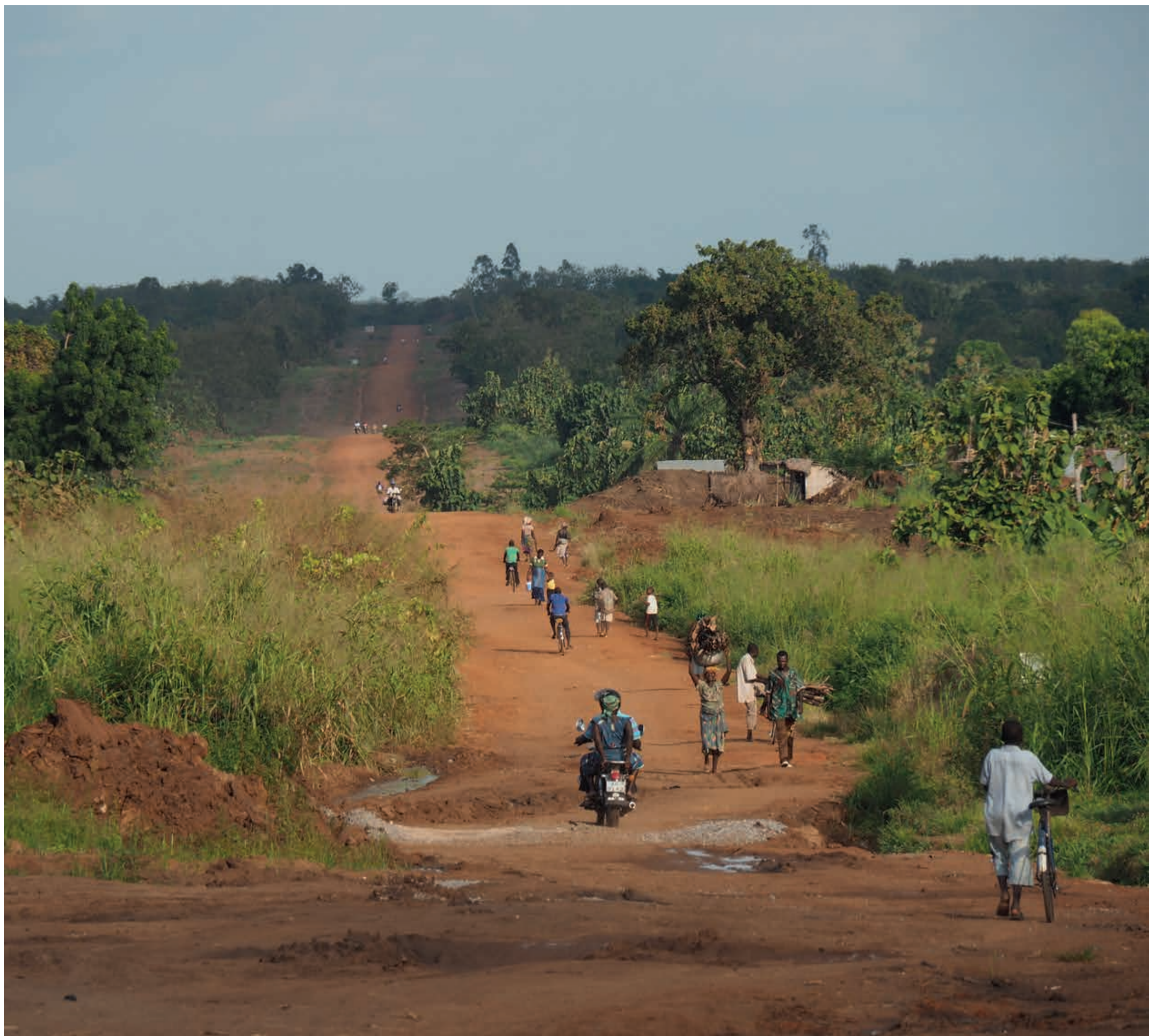
Togo: An der Überlandstraße nach Benin | Togo: On the interstate road to Benin | Togo: Sur la route nationale vers le Bénin