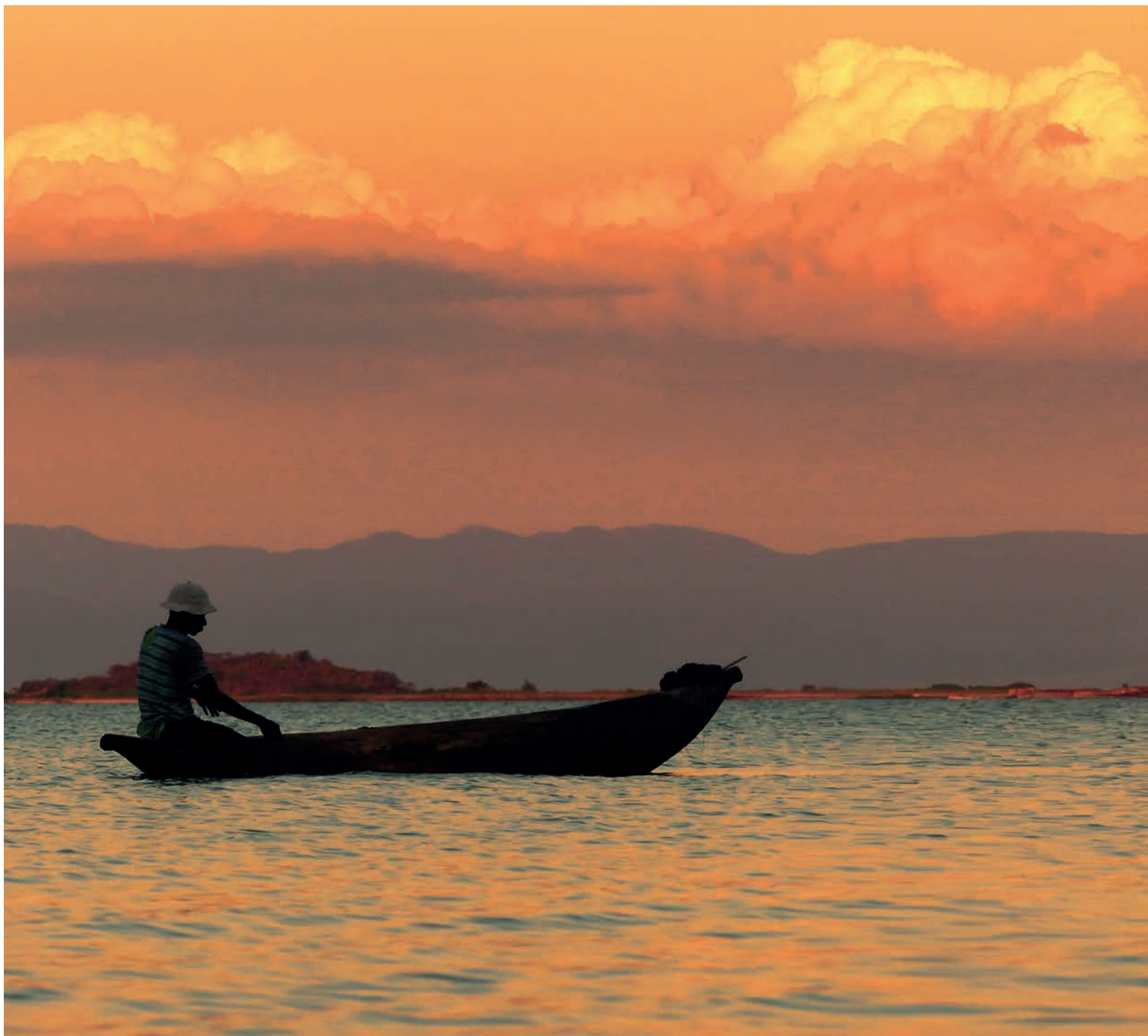
Abendlicher Fischfang am Malawi-See | Evening fishing at Lake Malawi | La pêche du soir sur le lac Malawi