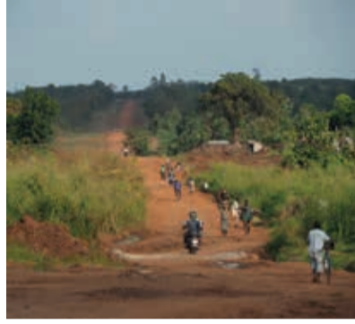
Juni Togo June Togo Juin Togo Wolfgang Blum