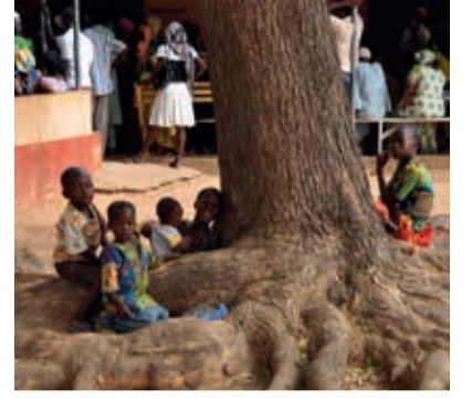
August Ghana August Ghana Août Ghana Rainer Lamotte