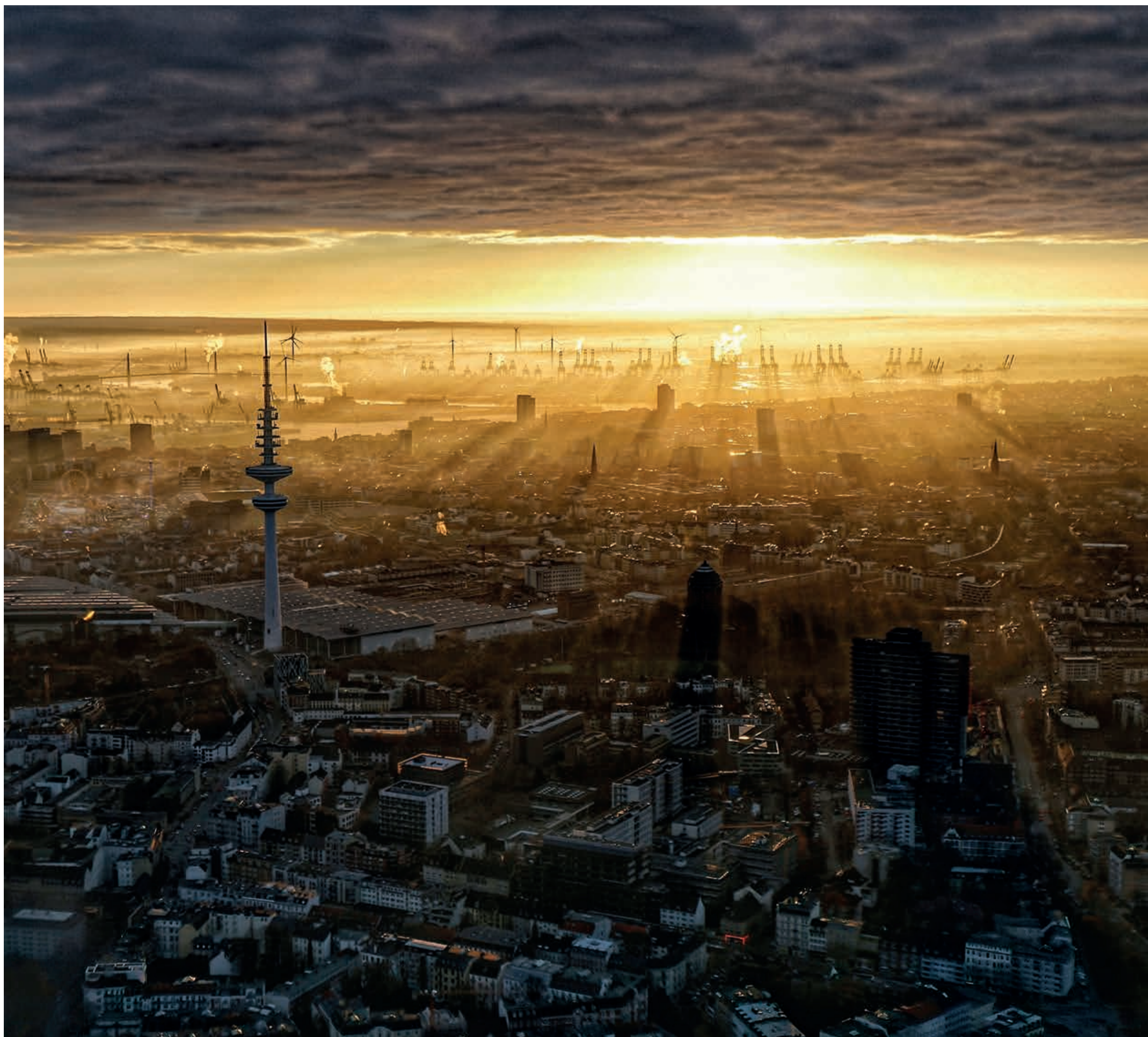
Sonnenuntergang über Hamburg | Sunset over Hamburg | Coucher de soleil à Hambourg