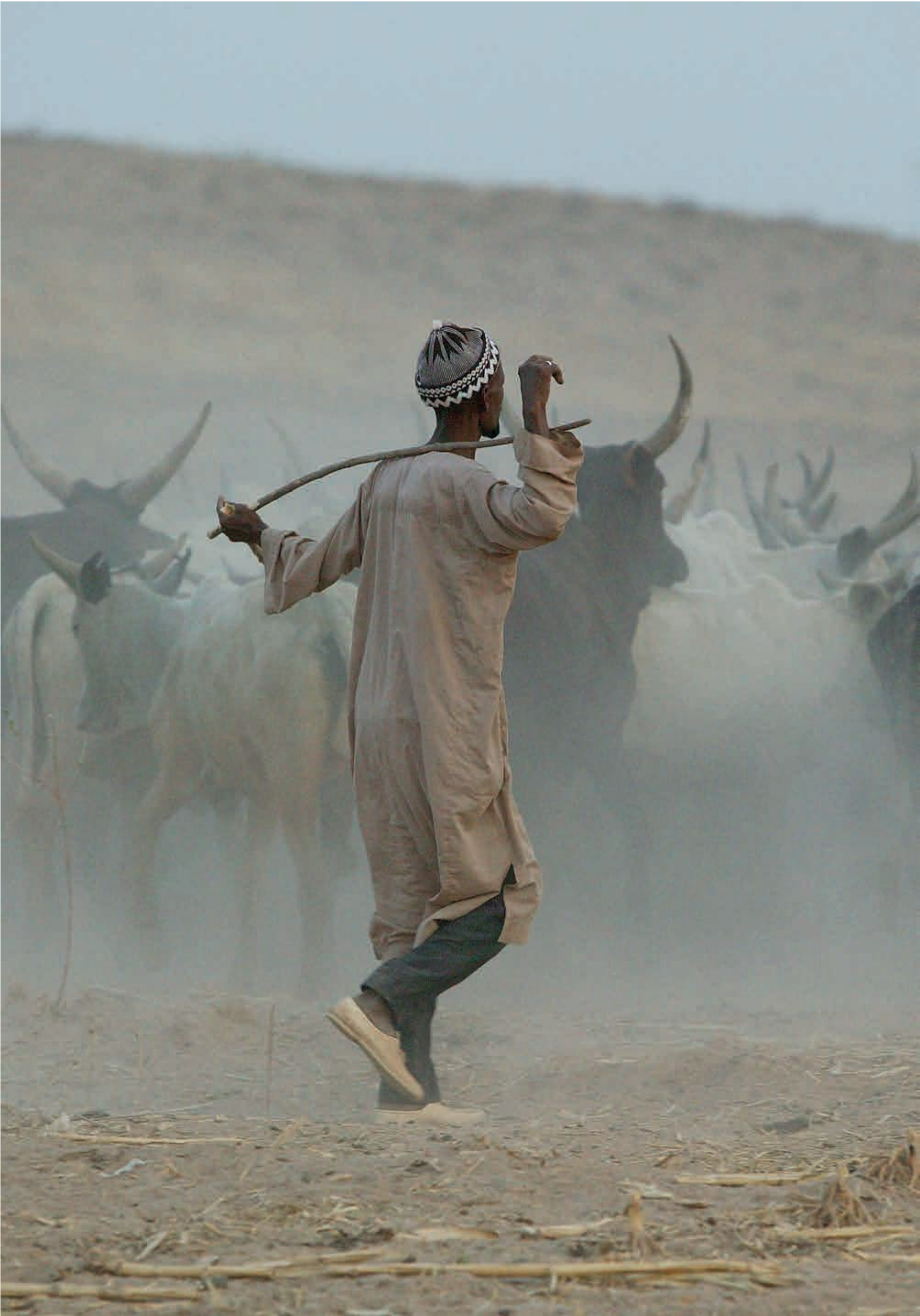
Kamerun: Hirten treiben Zeburinder in den Pferch | Cameroon: Shepherds driving zebus into their pen | Cameroun: Les bergers conduisent zébus dans le corral

Der Himmel ist der Himmel des HERRN; aber die Erde hat er den Menschenkindern gegeben. Ps 115,16