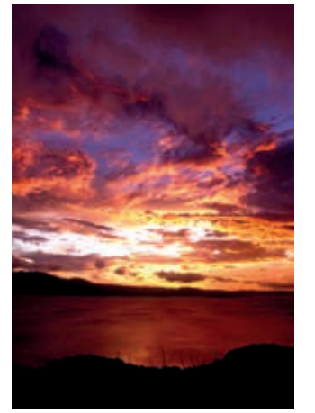
März Costa Rica March Costa Rica Mars Costa Rica Heiner Heine