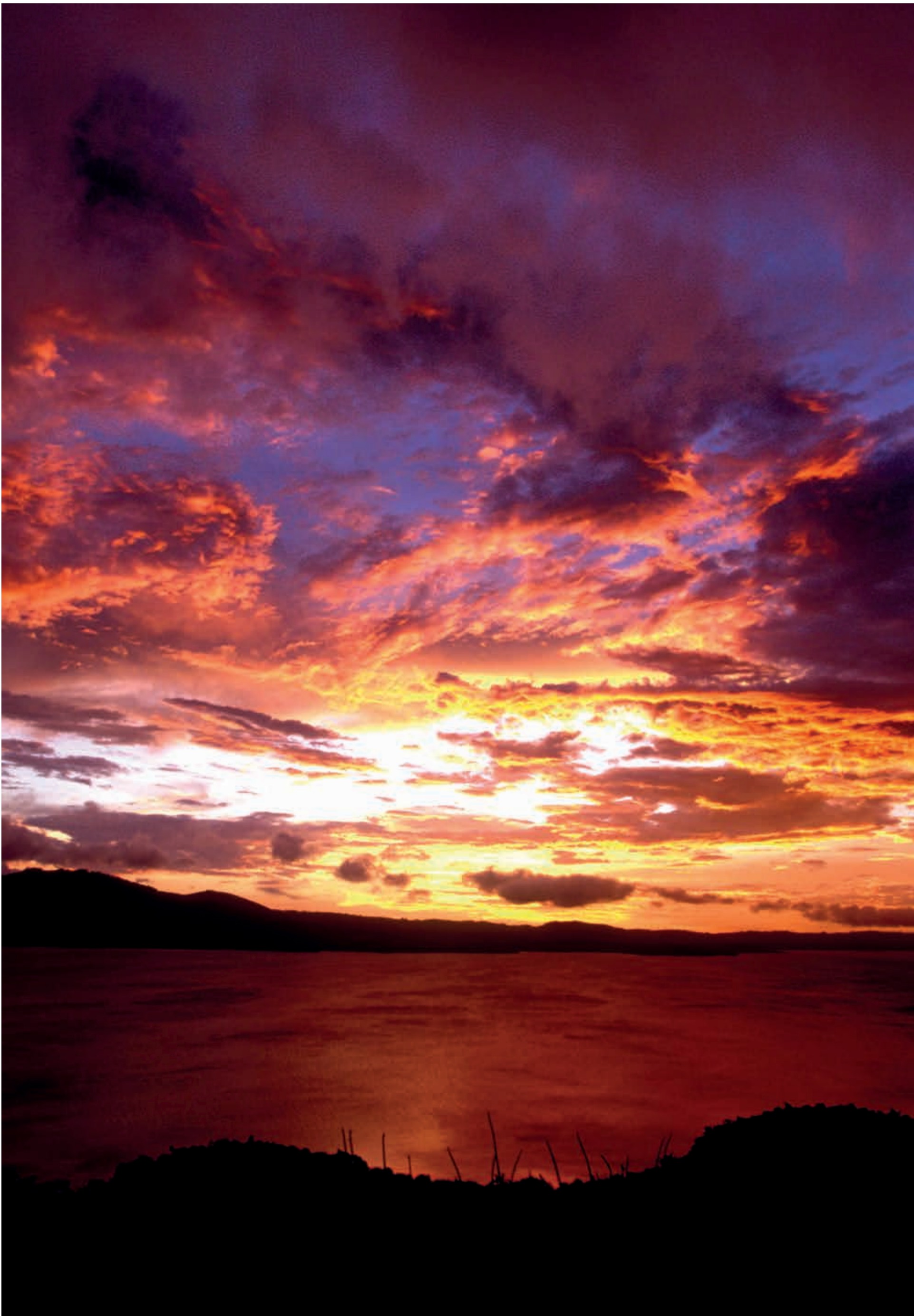
Sonnenuntergang am Arenal-See, Costa Rica | Sunset at Arenal Lake, Costa Rica | Coucher de soleil sur le lac Arenal, Costa Rica

HERR, deine Güte reicht, so weit der Himmel ist, und deine Wahrheit, so weit die Wolken gehen. Ps 36, 6