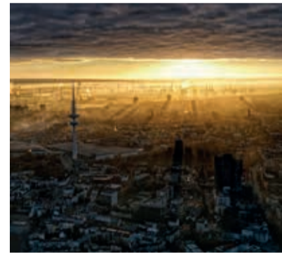
Dezember Deutschland December Germany Décembre Allemagne Polizei Hamburg