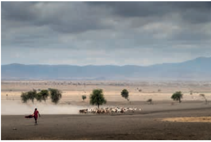
Titel Tansania: Masai mit Viehherde Titel Tanzania: Masai with cattle herd Titre Tanzanie: Masai avec troupeau Ulrich Kleiner