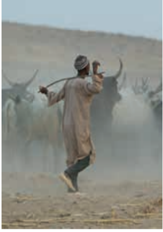
April Kamerun April Cameroon Avril Cameroun Heiner Heine