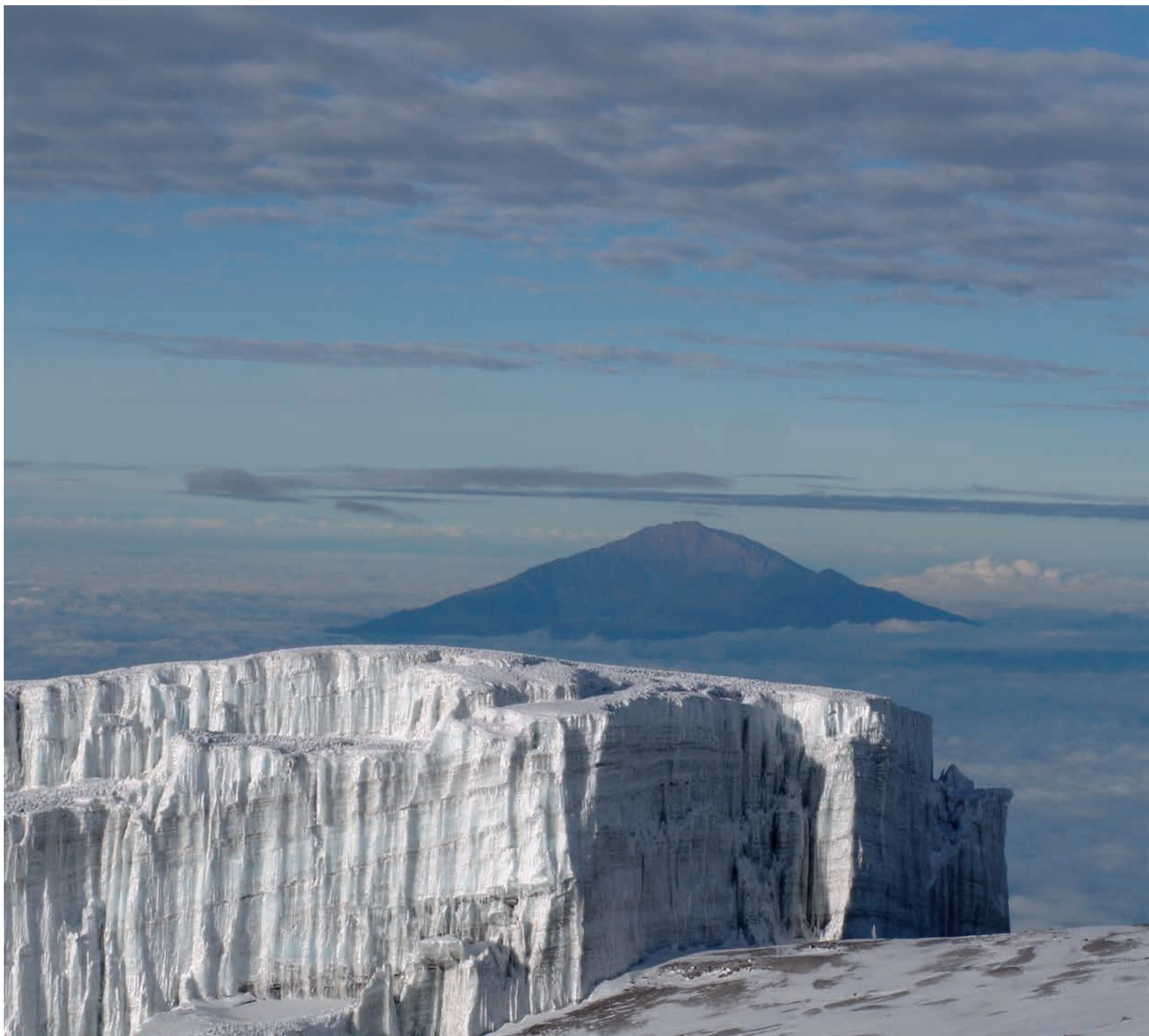
Tansania: Blick vom Kilimandscharo auf den Mount Meru | Tanzania: View from Mount Kilimanjaro to Mount Meru | Tanzanie: Vue du mont Kilimandjaro au Mont Meru