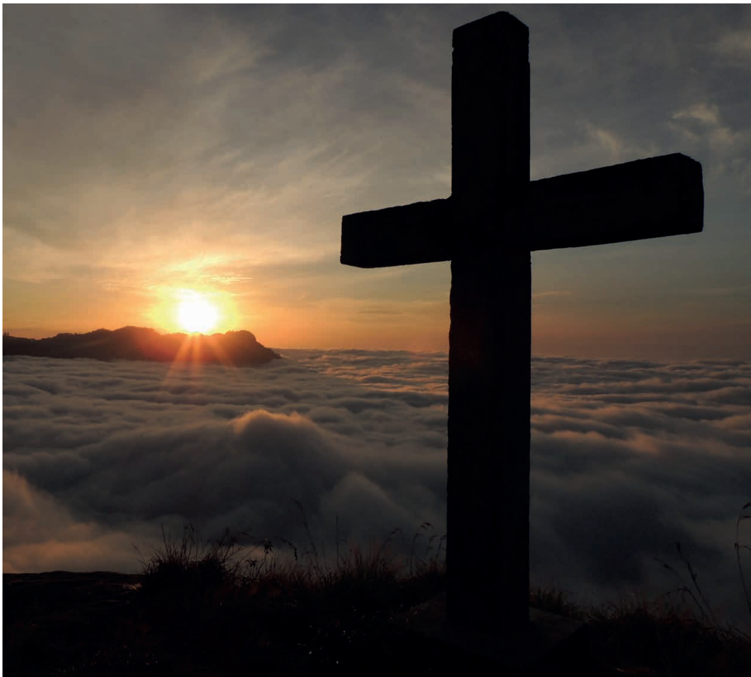
Tansania: Sonnenaufgang in den Usambara-Bergen | Tanzania: Sunrise in the Usambara mountains | Tanzanie: Lever du soleil sur les montagnes d'Usambara