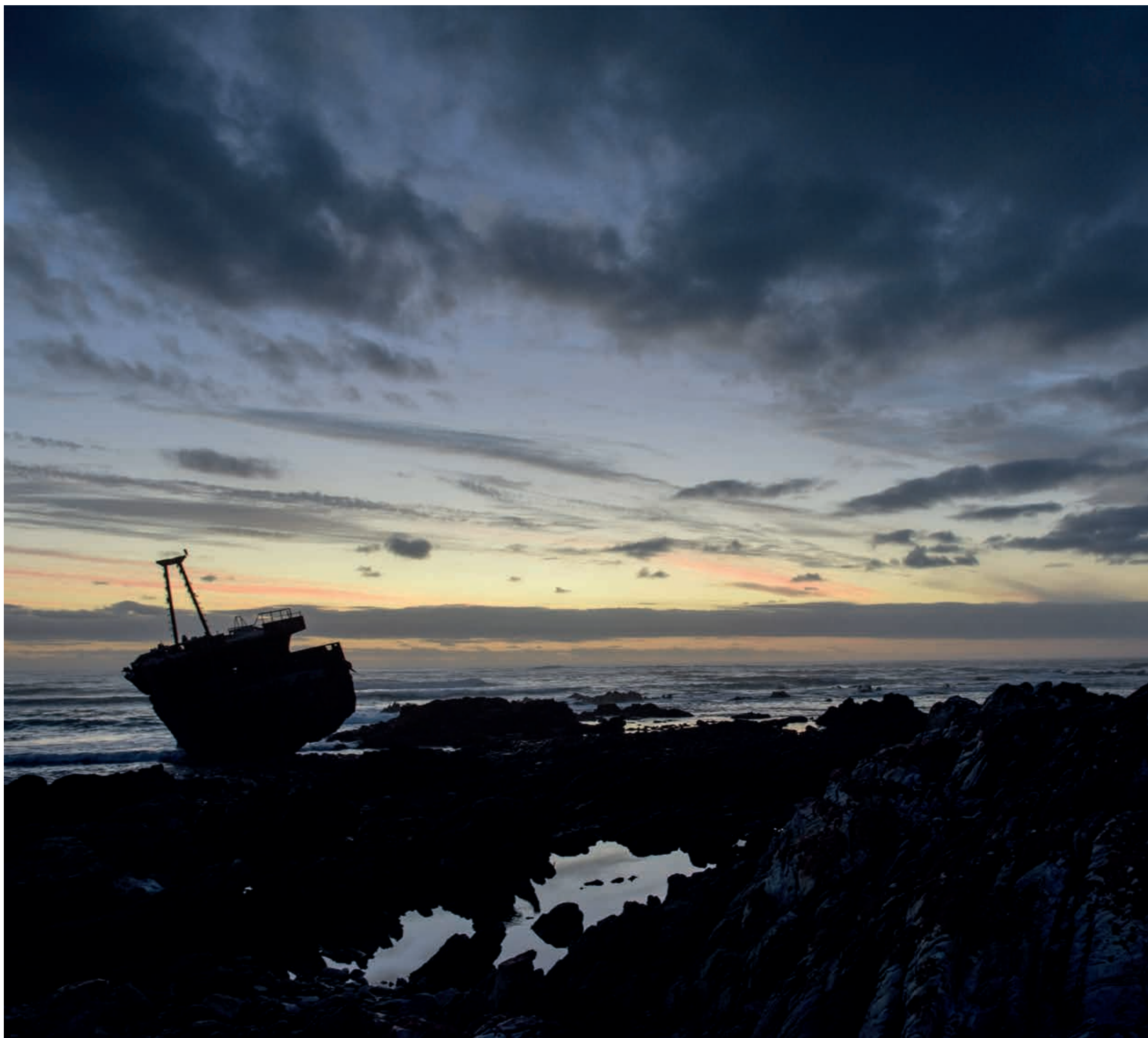
Am Kap Agulhas, dem südlichsten Punkt des afrikanischen Kontinents | At Cape Agulhas, the southernmost point of the African continent | Au Cap Agulhas, la pointe le plus au sud du continent africain