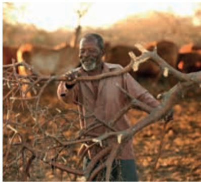
Oktober Botsuana October Botswana Octobre Botswana Heiner Heine