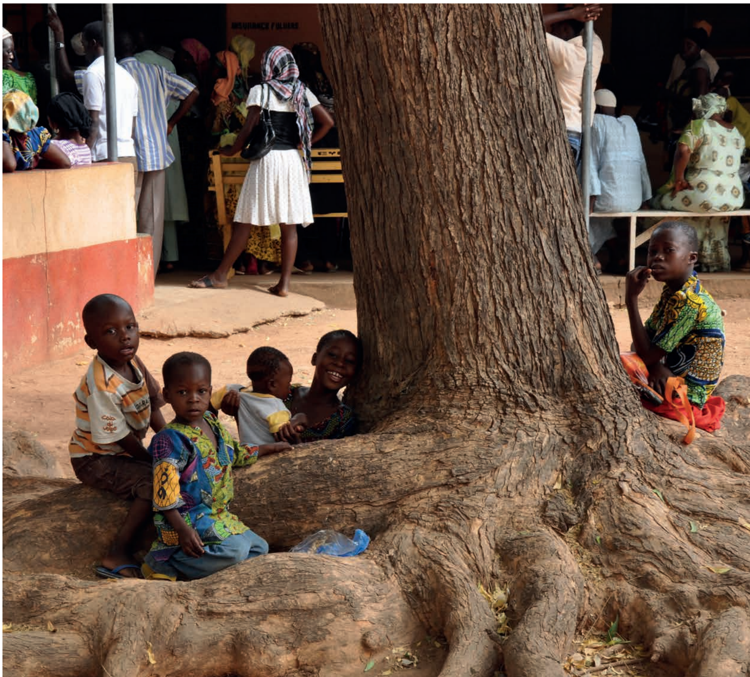
Wartende Kinder vor der Augenklinik in Bawku/Ghana | Children waiting in front of the eye clinic in Bawku/Ghana | Les enfants en attente de la clinique ophtalmologique à Bawku/Ghana