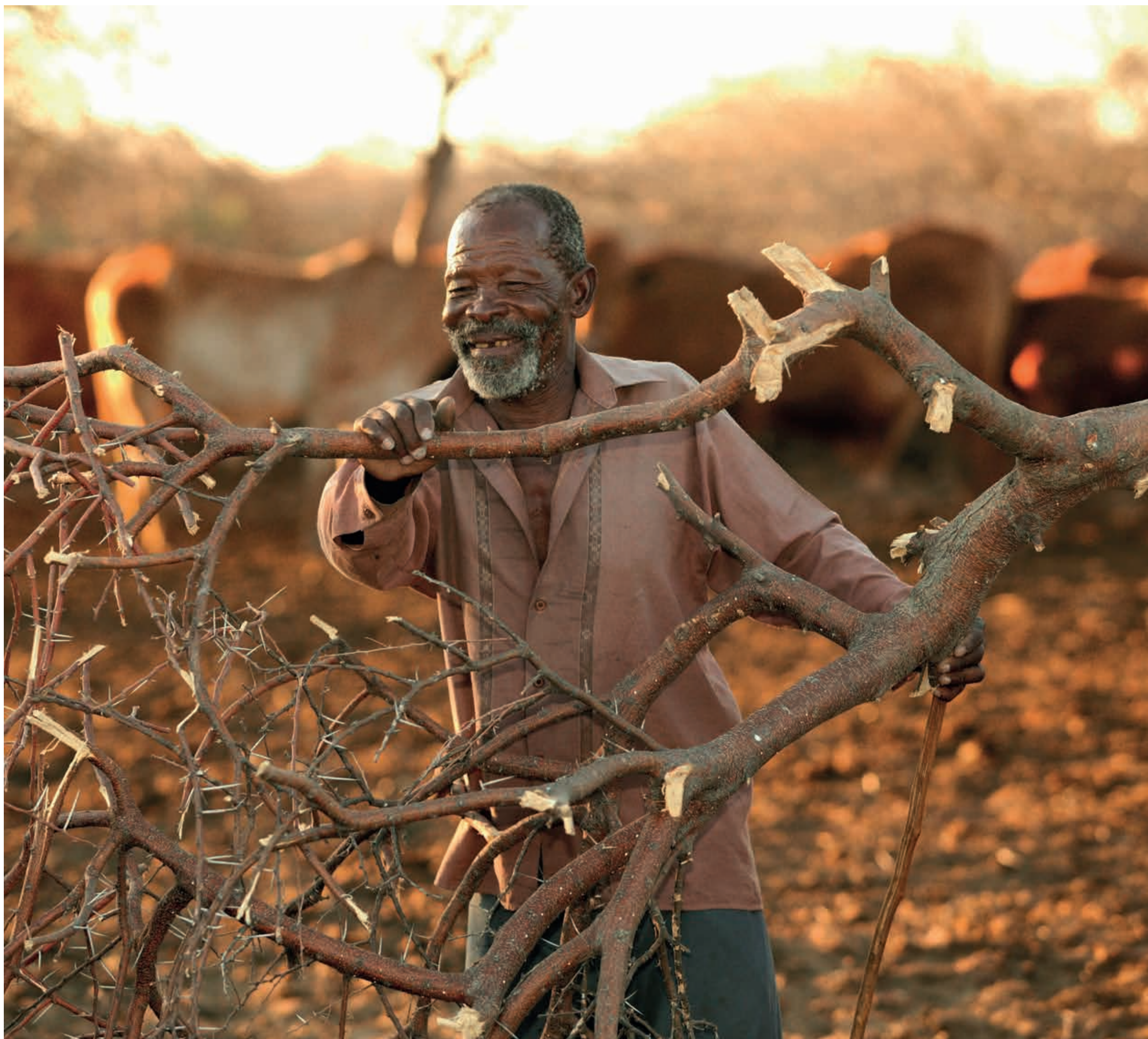
Botswana: Der Viehhirte schließt den Rinderferch | Botswana: Herdsman closing the cattle-horse | Botswana: Le bouvier conclut le corral