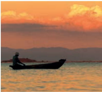
September Malawi September Malawi Septembre Malawi Klaus Schmiegel