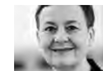
Ulrike Trautwein ist Generalsuperintendentin (Regionalbischöfin) des Sprengels Berlin und traf die indischen Pfarrerinnen 2019 in Ranchi.

Ich will Zeitgenossin sein und bleiben, nicht zuletzt um der Botschaft willen, die wir in die ganze Gesellschaft tragen wollen: Zur Freiheit sind wir berufen, zur Freiheit der Kinder Gottes. ▀